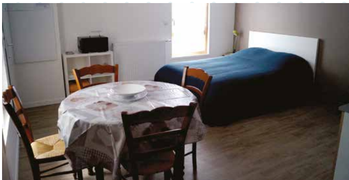
Le studio à la disposition des familles

Les concepteurs de la résidence Simone Veil répondent aux inquiétudes de leurs résidents. Le 23 avril, le personnel du Foyer Stéphanois est venu expliciter les différents réglages en les appliquant sur l'écran de l'un des appartements.