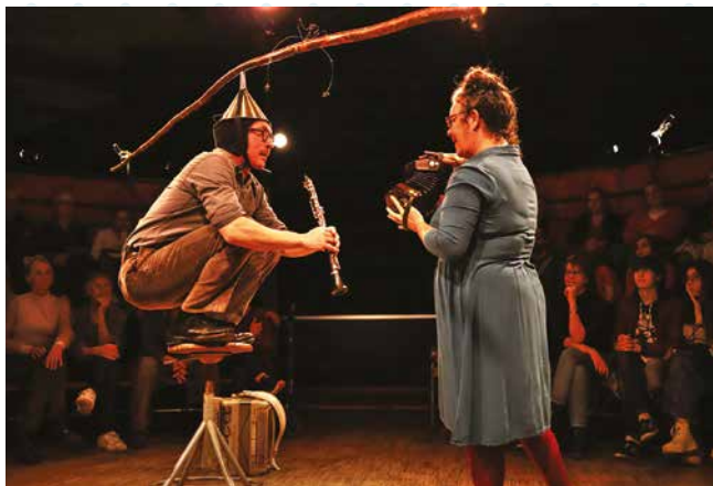
Spectacle Empreintes au festival Spring