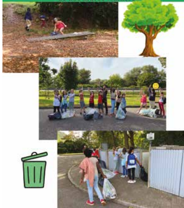
Ramassage des déchets sous forme de compétition en équipe au centre d'activités culturelles