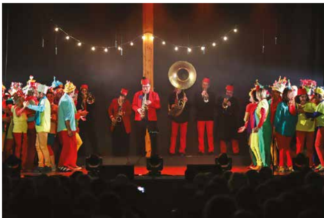
Chorale Coup de chant

Cette liste ne se veut pas exhaustive et certains événements n'y figurent pas : les concerts et le gala de danse de l'école de musique et de danse municipale, les représentations des ateliers de théâtre et de la troupe amfrevillaise Mi-voix, Mi-scène, les soirées jeux et les contes à la bibliothèque, les épreuves de dictée du musée des écoles, etc. Nous vous invitons à consulter régulièrement l'agenda du site internet sur www.amfreville-la-mivoie.fr , ainsi que la page facebook du centre culturel pour être au courant de tout.