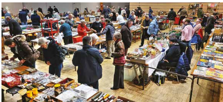
Salon Fèves et toutes collections

Le Comité d'action culturelle organise chaque année depuis plusieurs dizaines d'années les traditionnels Salon artisanal et fermier, au mois de novembre et Salon des fèves et toutes collections, au mois de janvier.