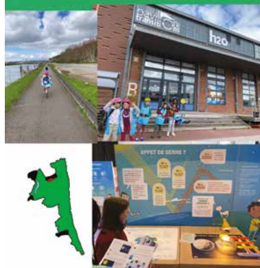
Départ en vélo et trottinette pour le Pavillon des transitions sur les quais de Seine 'H2O' Apprendre à protéger une ressource en danger : L'EAU

Le CMJ reste mobilisé et mobilisable sur de nombreuses actions au sein d'Amfreville.