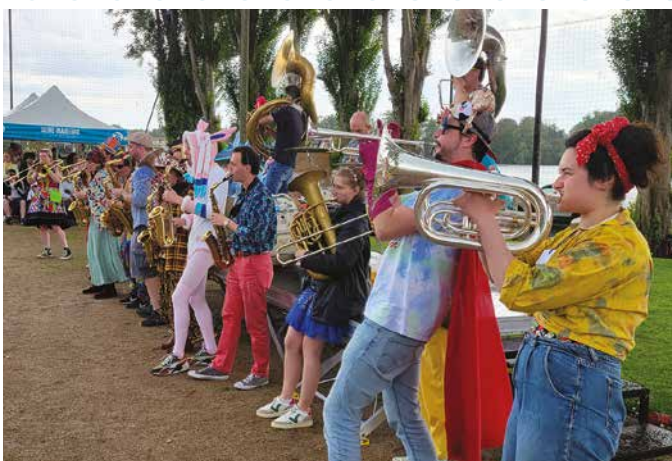
La fanfare Vashfol à la Garden Party

L'humour est un bon remède contre les soucis actuels et il rencontre un succès croissant auprès du public qui en redemande. Forts de cette constatation et après l'annonce de l'arrêt du festival Rire en Seine, les élus de cinq villes du Plateau Est, dont Amfreville, ont décidé de se regrouper en 2021 afin de proposer une programmation commune durant le mois d'octobre.