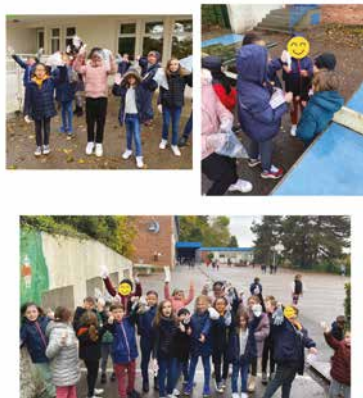
Nettoyage de cour de récréation en collaboration avec les élèves