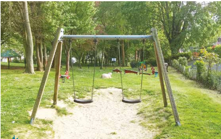
Un jardin proche du parc pour enfants