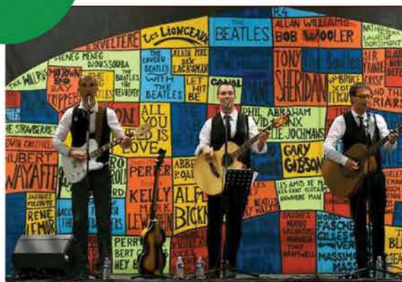
The Beatles' Artifact