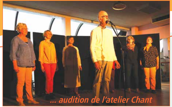
... audition de l'atelier Chant