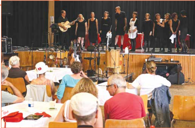
... le tremplin des talents inconnus