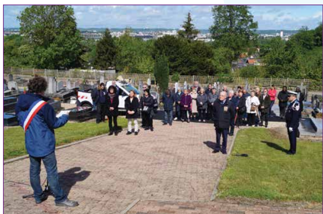
Commémoration du 8 mai 1945

Organisée par le Comité des fêtes, le samedi 28 septembre 2019 de 21 h à 3 h du matin. En première partie : un show transformiste avec Angie Queen - En seconde partie : soirée dansante animée par les Andrews - Entrée : 10 € - Réservations au 02 35 23 65 36 ou au 02 35 23 70 36