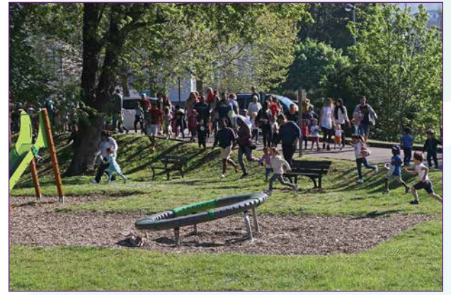
Le départ de la chasse aux oeufs organisée par le Comité des fêtes